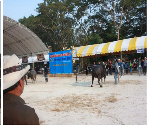
ชักคะเย่ควาย