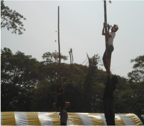
แข่งขันปีนเสาน้ำมัน