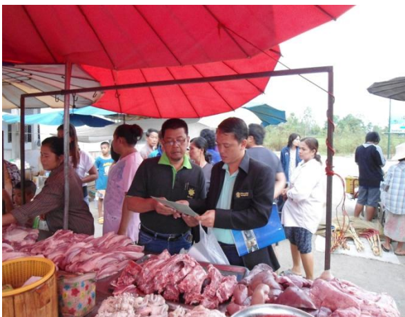
เจ้าหน้าที่ตรวจเอกสารผู้ประกอบการเขียง