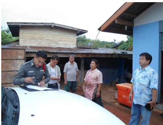
เจ้าหน้าที่สอบปากคำเบื้องต้น