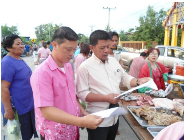
เจ้าหน้าที่ตรวจเอกสารผู้ประกอบการเชียงใหม่