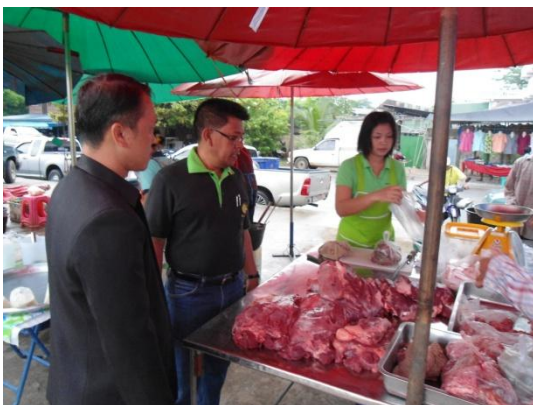
เจ้าหน้าที่ตรวจเอกสารผู้ประกอบการเชียง