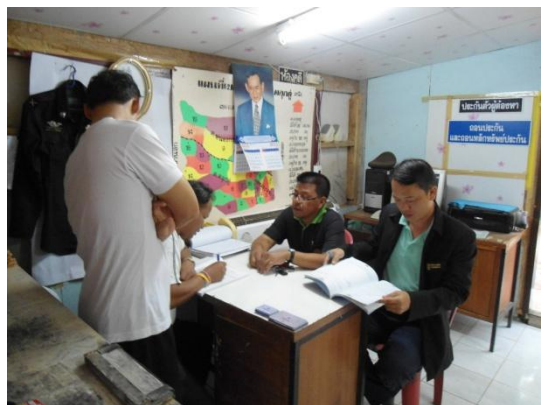
ภาพแสดงผู้ประกอบการกำลังจำหน่ายเนื้อสุกร

ข่าวและภาพข่าวโดย นายสมพร บุญชื่น อนุมัติข่าวโดย นายเชิงชาญ พึ่งเจียม