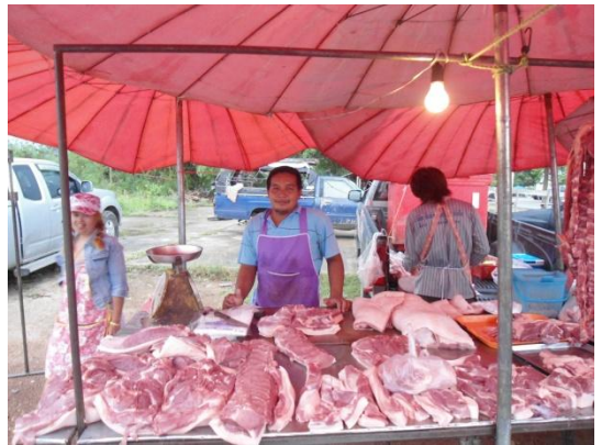
ผู้ประกอบการที่ได้รับการตรวจสอบจากเจ้าหน้าที่