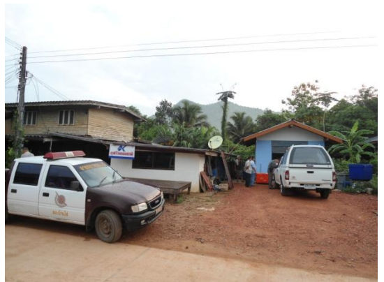
เจ้าหน้าที่เข้าตรวจสอบและจับกุม