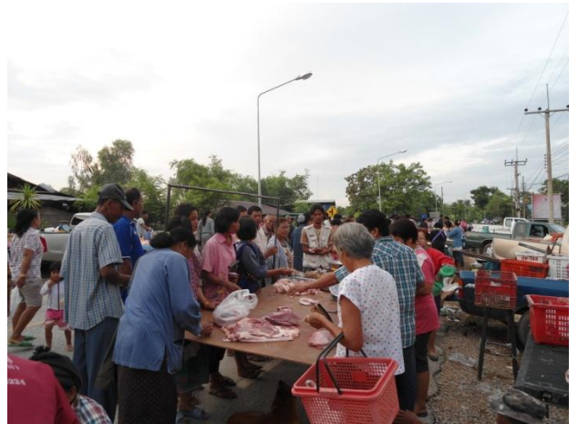
ผู้ประกอบการที่ได้รับการตรวจสอบจากเจ้าหน้าที่