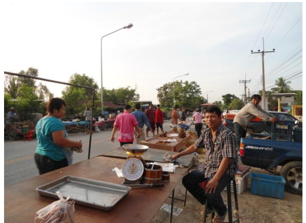
ผู้ประกอบการที่ได้รับการตรวจสอบจากเจ้าหน้าที่