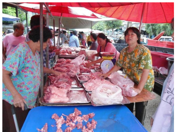
ภาพแสดงผู้ประกอบการกำลังจำหน่ายเนื้อสุกร

ข่าวและภาพข่าวโดย นายสมพร บุญชื่น อนุมัติข่าวโดย นายเชิงชาญ พึ่งเจียม