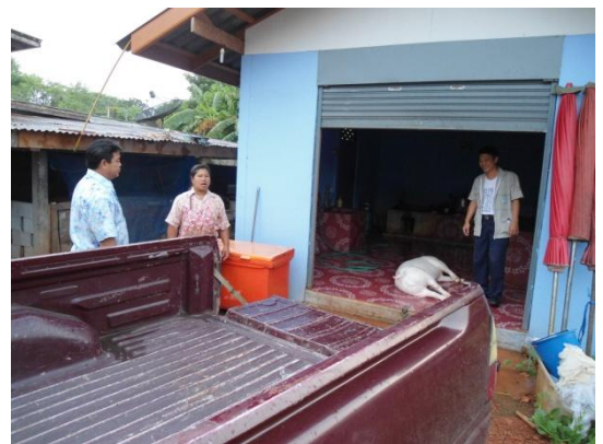
เจ้าหน้าที่เตรียมเคลื่อนย้ายซากเพื่อทำลายทิ้ง

ข่าวและภาพข่าวโดย นายสมพร บุญชื่น อนุมัติข่าวโดย นายเชิงชาญ พึ่งเจียม